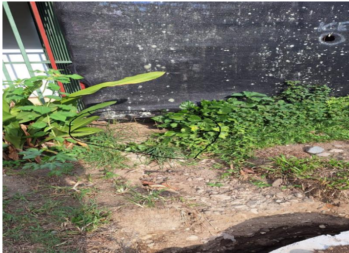
10 Imagen N#5 evidencia del desfogue natural---