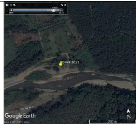
Figura 3 En la foto de 2017 no está la concesión.