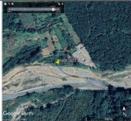
Figura 4 En 2020 ya se observa material apilado en la margen del río.