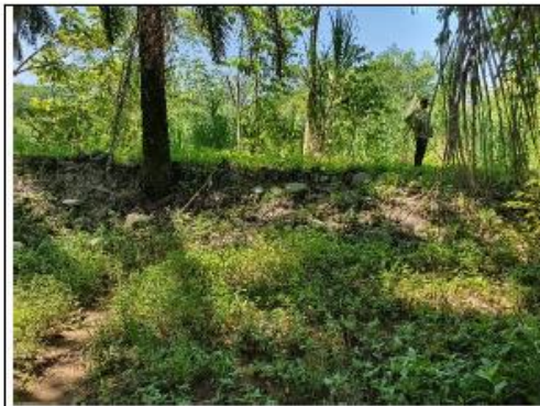
Figura 2 En la margen derecha hay un dique.