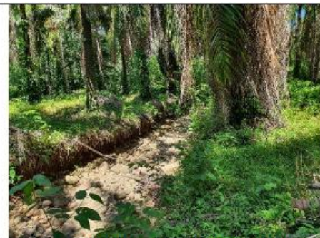
Figura 5 A varios metros de la margen derecha se observan canales con arena y cantos rodados de río.