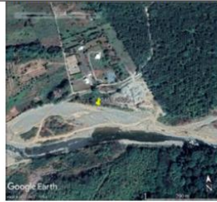
Figura 4 Actualmente se observa unas estructuras al norte de la concesión.