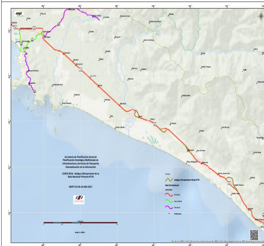
Anexo:08 inventario caminos nacionales en Quepos oficio N° MOPT-01-06-14-083-2017