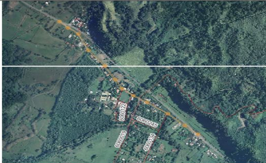
Anexo 05 Matapalo CRTM05 X: 504166 Y: 1032455 hasta las coordenadas CRTM05 X: 505195 Y: 1031380

1 Por otra parte se requiere mejorar la carpeta de rodamiento del ingreso hacia 2 Matapalo con recarpeteo sobre la carpeta asfáltica existente, para así dar mejores 3 condiciones de servicio a la calle del antiguo alineamiento de la ruta nacional N°34. 4 Se muestra imagen satelital (anexo 05). Es importante destacar que es el ingreso al 5 centro de Matapalo a su plaza y sus playas. La cual beneficia aproximadamente a 6 600 habitantes más la visitación turística de dichas playas, por tanto dotar de 7 condiciones de idoneidad sus ingresos también ayuda a mantener el turismo y la 8 economía de la zona. Por tanto se recomienda mejorar dicho tramo el cual consta 9 con una longitud aproximada de 1512 metros desde las coordenadas CRTM05 X: 10 504166 Y: 1032455 hasta las coordenadas CRTM05 X: 505195 Y: 1031380, se 11 adjunta extracto del mapa de caminos del MOPT, donde se evidencia que pertenece 12 al antiguo alineamiento de la ruta nacional N°34, como se evidencia en anexo 06.