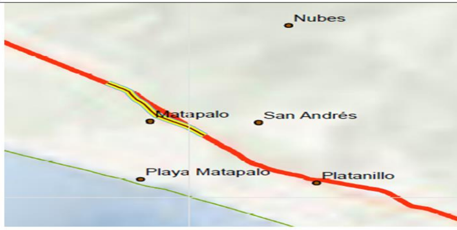
Anexo 06 mapa de antiguo alineamiento del MOPT