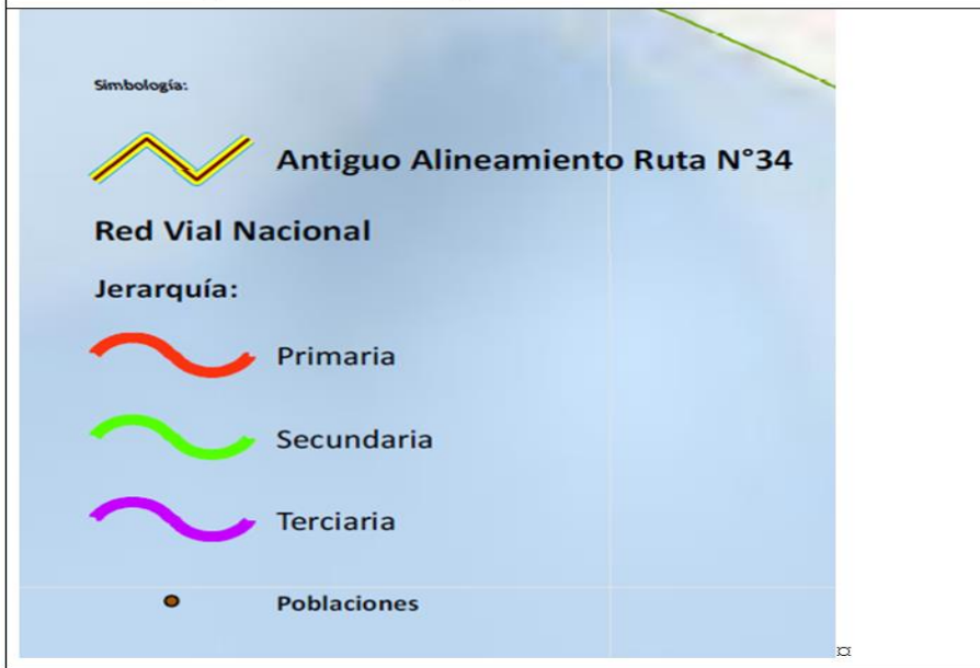
Anexo07: simbología de caminos del Mopt