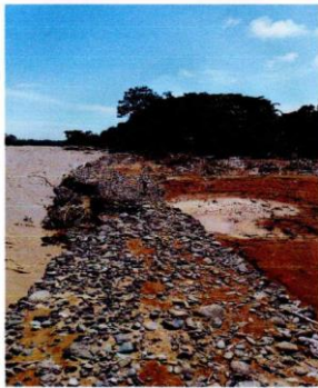
Esta es una imagen del mismo sector, pero del año 2017, con la tormenta Nate, cuando rompió camino y arrasó con todo a su paso por las parcelas.