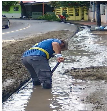
Imágenes 3-4. Limpieza manual de cunetas y vía Pública.