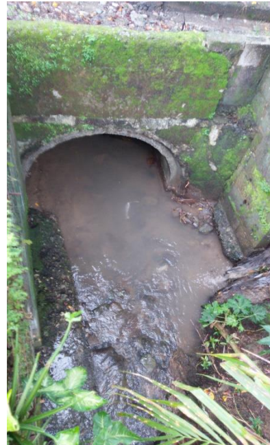
Imágenes 5-6. Limpieza de canal en el Invu de Quepos.