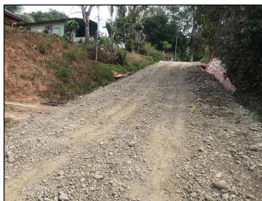
Fotos 5 y 6. Inspección de campo, Vía Pública C6-06-189-00.

Quedo a sus órdenes para cualquier información adicional sobre el particular.