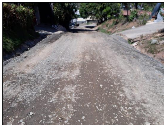
14 15 16 Fotos 3 y 4. Intervención, Vía Pública C6-06-189-00.