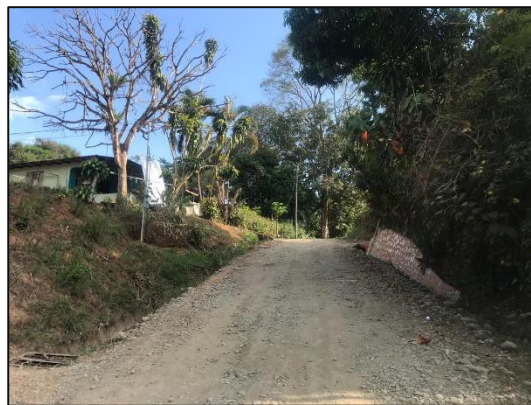
6 7 Fotos 1 y 2. Inspección de campo, Vía Pública C6-06-189-00.