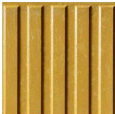
Loseta Táctil lineal para continuidad de paso.