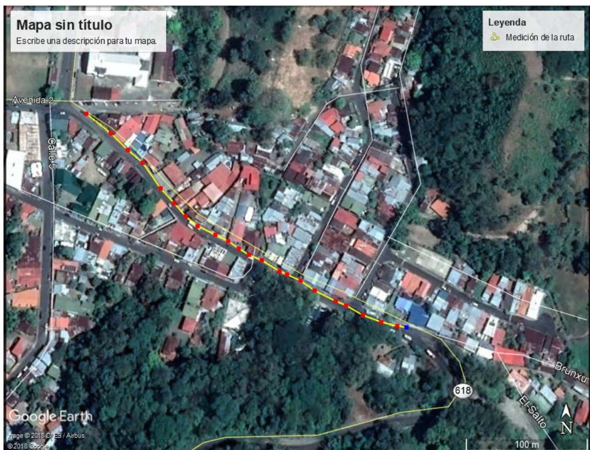
Calle hacia Manuel Antonio, ruta nacional 618, Quepos, Costa Rica.

Las obras deben ejecutarse en el tramo que comprende desde las cercanías de la iglesia católica de Quepos, hasta la bifurcación de las ruta nacional 618 y la calle cantonal código C-6-06-205. Coordenadas CRTM 05 para el primero punto 482440.4 E / 1042642.8 N. y para el segundo punto 482745.1 E / 1042445.5 N. para un total aproximado de 340 metros lineales, con un promedio de 1.20 metros de ancho.