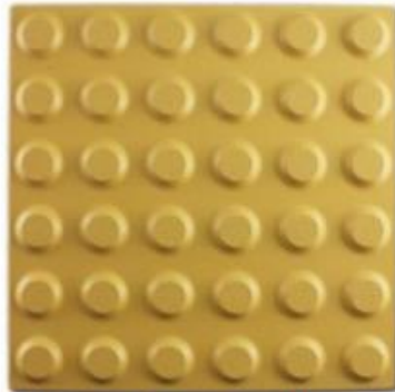
Loseta Táctil de inicio, salida y obstrucciones.