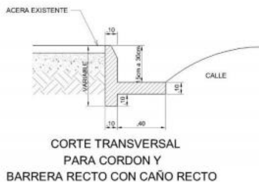
CORTE TRANSVERSAL PARA CORDON Y BARRERA RECTO CON CAÑO RECTO

Detalle Típico de cordón y caño. Concreto 210 kg/cm 2 o superior.