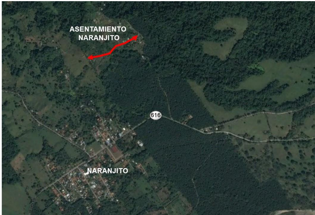
Figura 1. Ubicación de proyecto detallado con la línea roja

Las obras, consisten en la mejora de la superficie de ruedo, garantizando un perfil adecuado a las condiciones de una calle en lastre. Por lo que, se proponen obras como: